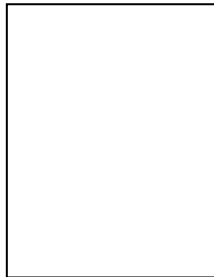
An tOll. F. Ruane Stiúirthóir